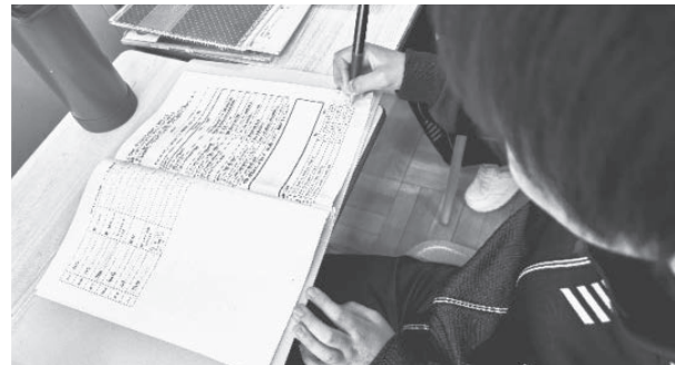
【必然性をもって書く活動に取り組む子ども】

用して「自分の理想の1日を想像日記として発表する」という学習課題を設定し、目的意識をもって書く活動を展開した。子どもたちは「どんな情報を伝えれば、相手に伝わるのか」を考えながらライティングに取り組み、発表後には相互評価を行った。