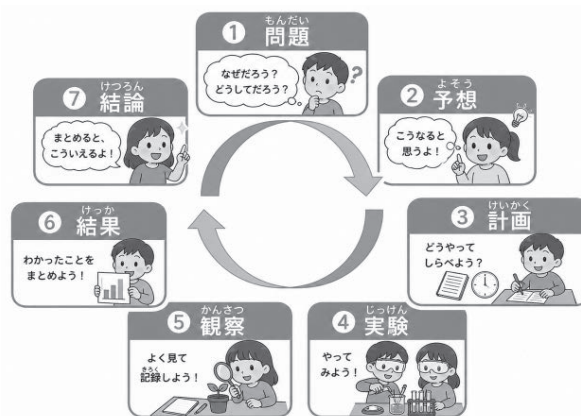
【探究的な学習の流れ】

表現力の指導として、「～だと考える。なぜなら～だからである」といった型を示すことで、論理的に説明する力の育成が期待できるだろう。また、子ども同士の対話を通して多様な考えに触れることで、思考の深化につながるだろう。