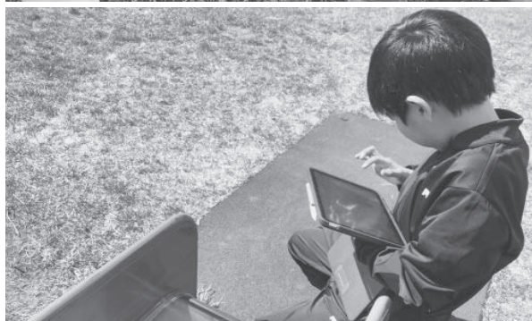
【1人1台端末を利用して観察をする様子】